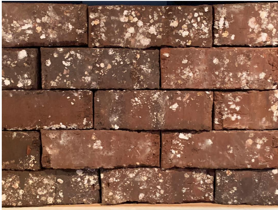
Demerbloem bruine uitvoering mod 65