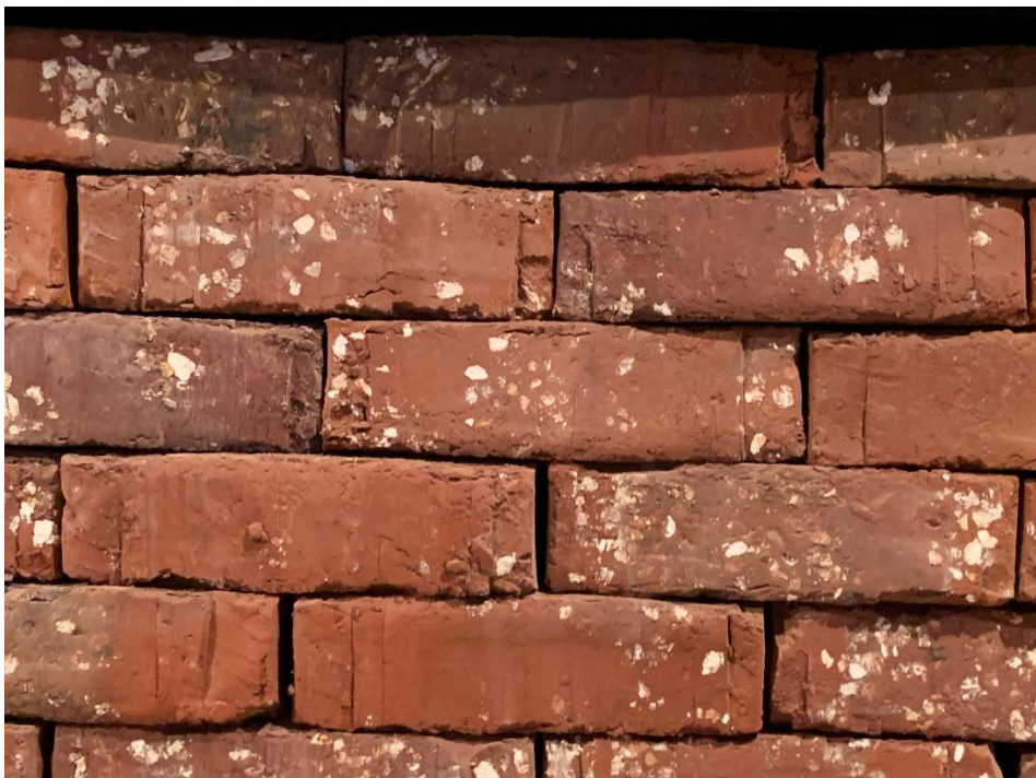
Demerbloem rode uitvoering mod 57